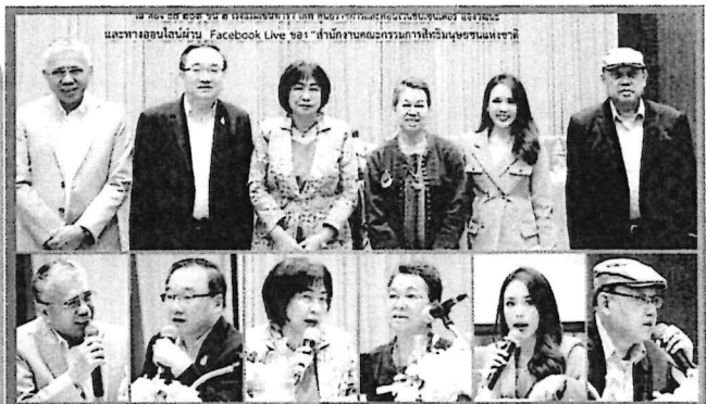
กสม. จัดเวที "มองรอบด้านกับโครงการแลนด์บริดจ์" นำเสนอความคิดเห็นทางวิชาการต่อสาธารณะ